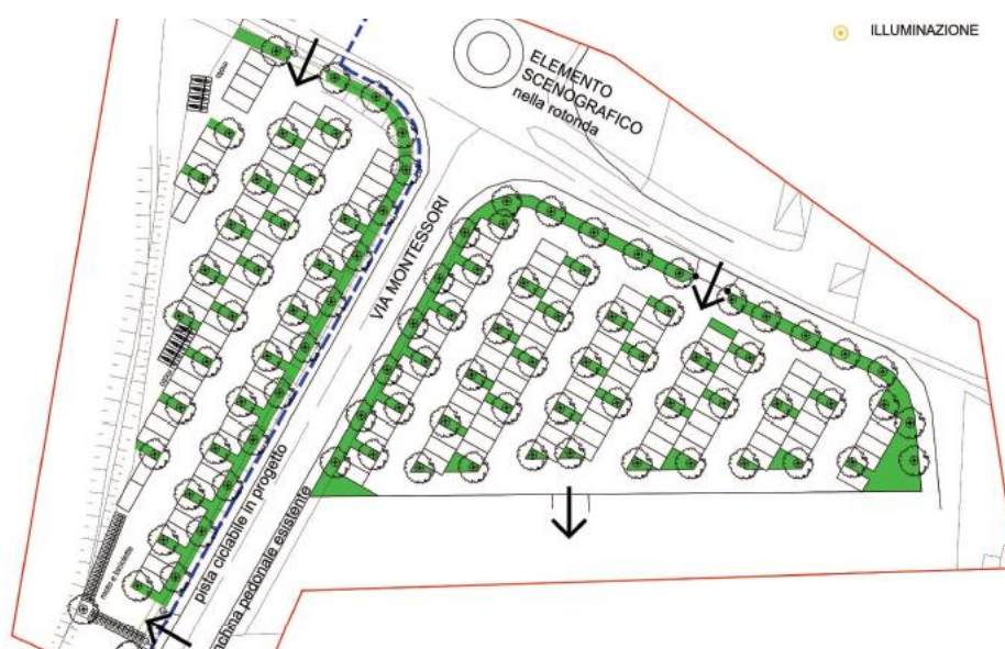
Rappresentazione esemplificativa di come verrà realizzato il parcheggio di Via Pirandello, con elementi verdi in piena terra e pavimentazioni drenanti.