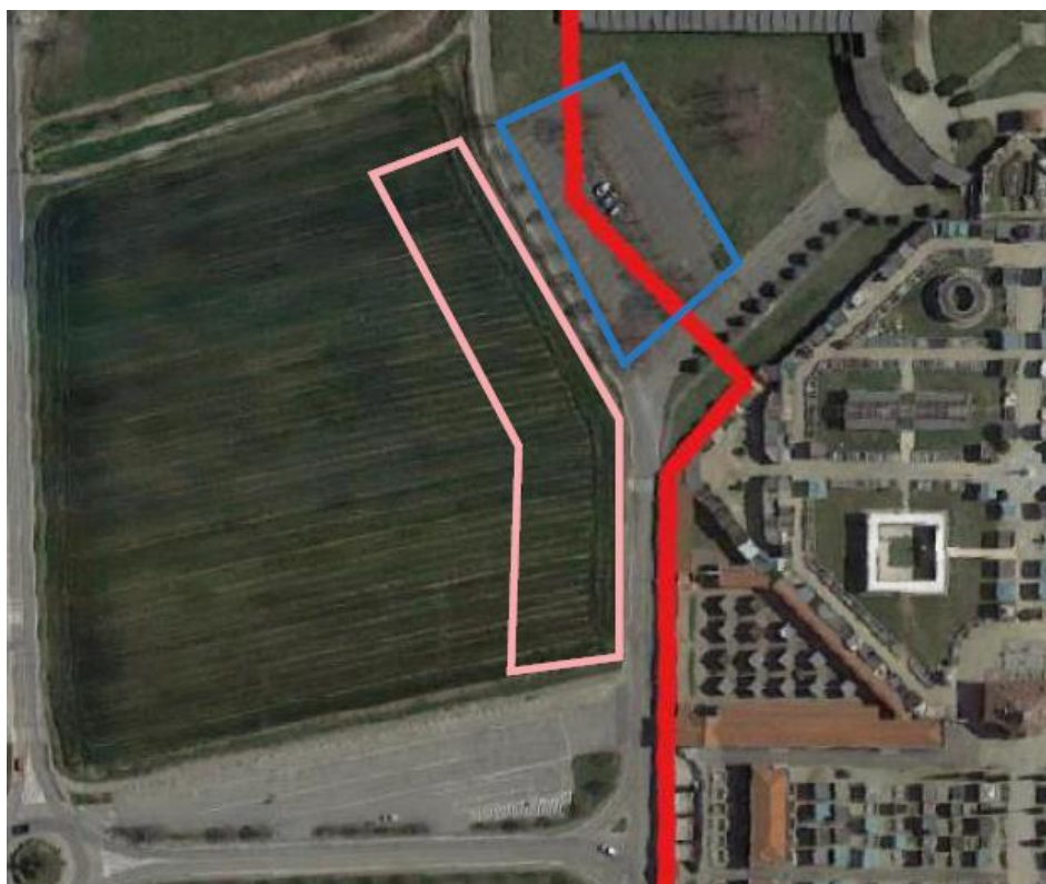
Lo spicchio oggetto di ampliamento con il nuovo perimetro previsto (in rosso), l'area parcheggio in dismissione che vi insiste e il parcheggio lungo via Pirandello con l'area di ampliamento (perimetrazione rosa).

sottratte dall'ampliamento prevedendone una nuova maggiore dotazione in termini di superfici in piena terra.