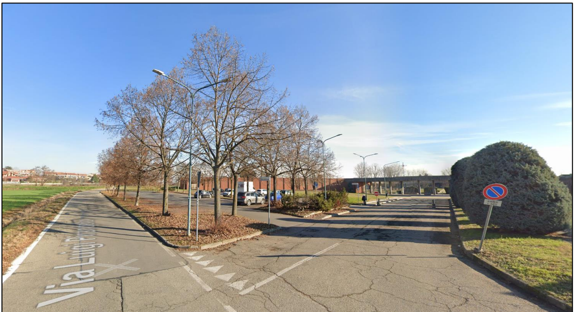
Vista da est del parcheggio esistente sull'area di ampliamento.