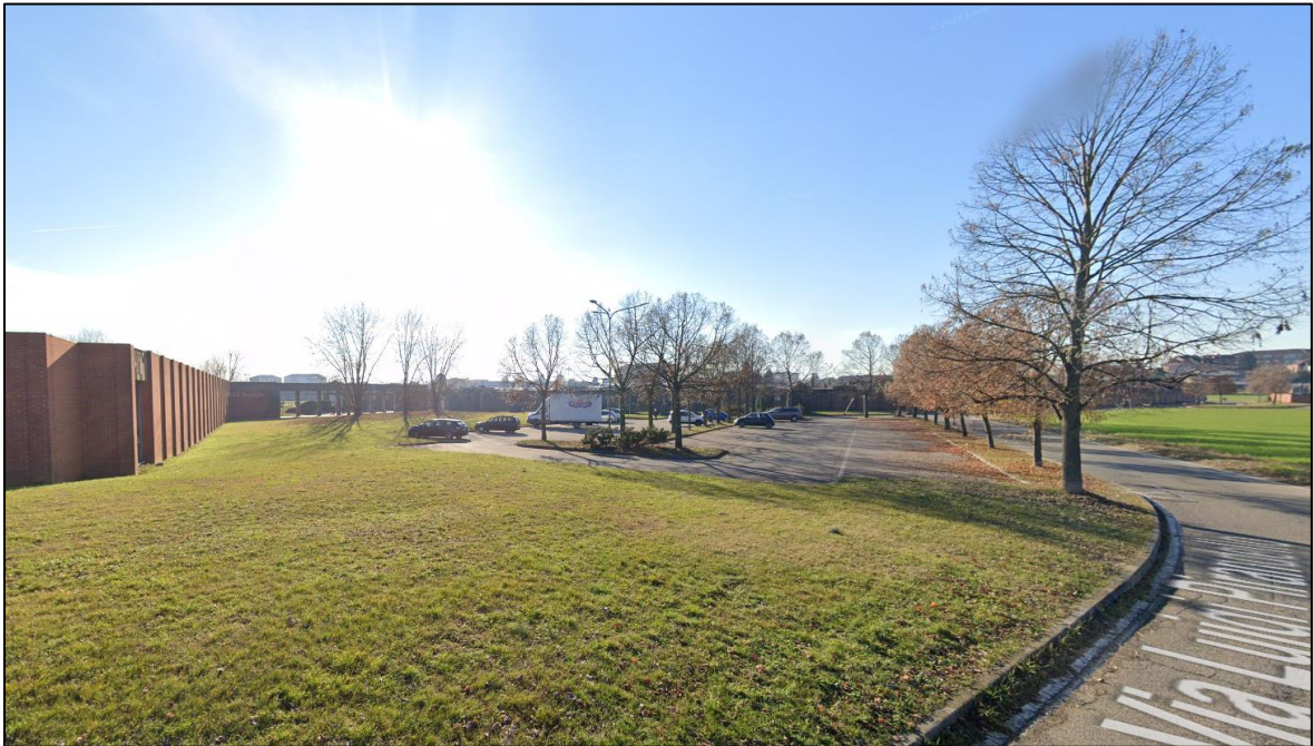
Vista da ovest del parcheggio esistente sull'area di ampliamento.

Per quanto riguarda i parcheggi, l'ampliamento porterà all'eliminazione dell'attuale area di parcheggio asfaltata. Il fabbisogno di aree sosta sarà assolto dall'ampliamento del parcheggio attualmente presente all'angolo tra via Montessori e via Pirandello, già previsto come area a servizi sul PRG, il quale sarà esteso lungo quest'ultima via, ma che avrà caratteristiche completamente differenti: esso sarà previsto su fondo drenante e con aree alberate e in piena terra, come rappresentato nello schema esemplificativo (inerente a un altro parcheggio in progetto a Chieri) riportato nella pagina seguente.